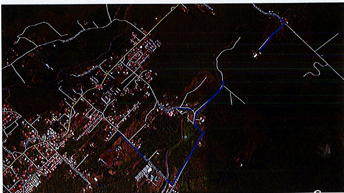
Plan de situation des réseaux à renforcer sur le secteur de Dureau

Accusé de réception en préfecture 974-219740065-20180301-DCM04-010318- DE Date de télétransmission : 05/03/2018 Date de réception préfecture : 05/03/2018